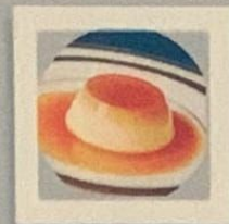
FLAN MAISON 8.00