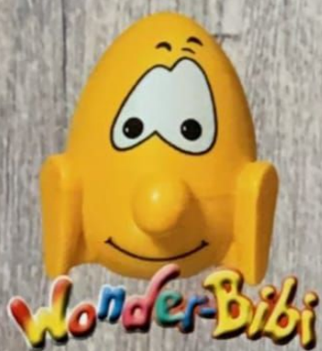
Wonderbibi Glace Stracciatella avec sa surprise Fr. 6.00