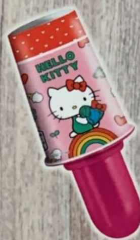
Hello Kitty Stick Vanille - Fraise, nouveaux stickers amusants pour jouer et collectionner dans le bâton Fr. 6.00