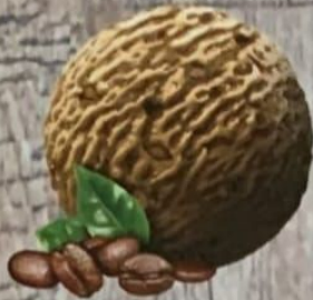
Mocca * avec noisettes croquantes