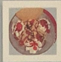
BOLO DE BOLACHA 8.00