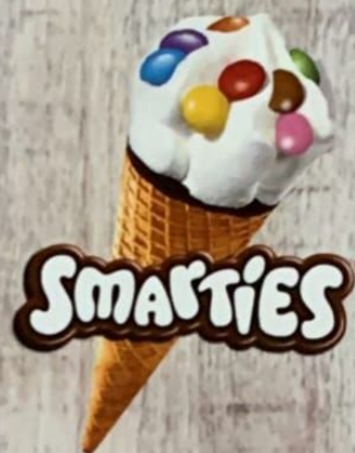
Smarties Cornet Cornet Vanille avec Smarties Fr. 4.00