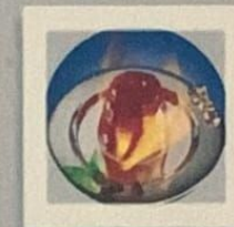
PARFAIT MOCCA NATURE 8.00 FLAMBÉ 12.00