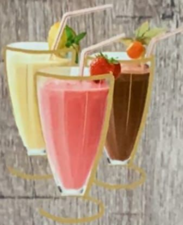
Frappé Arômes aux choix Fr. 8.50