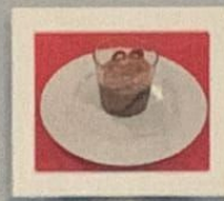
MOUSSE AU CHOCOLAT 8.00