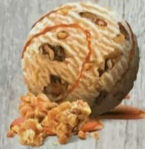
Tarte aux noix