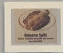
BANANA SPLIT 12.00